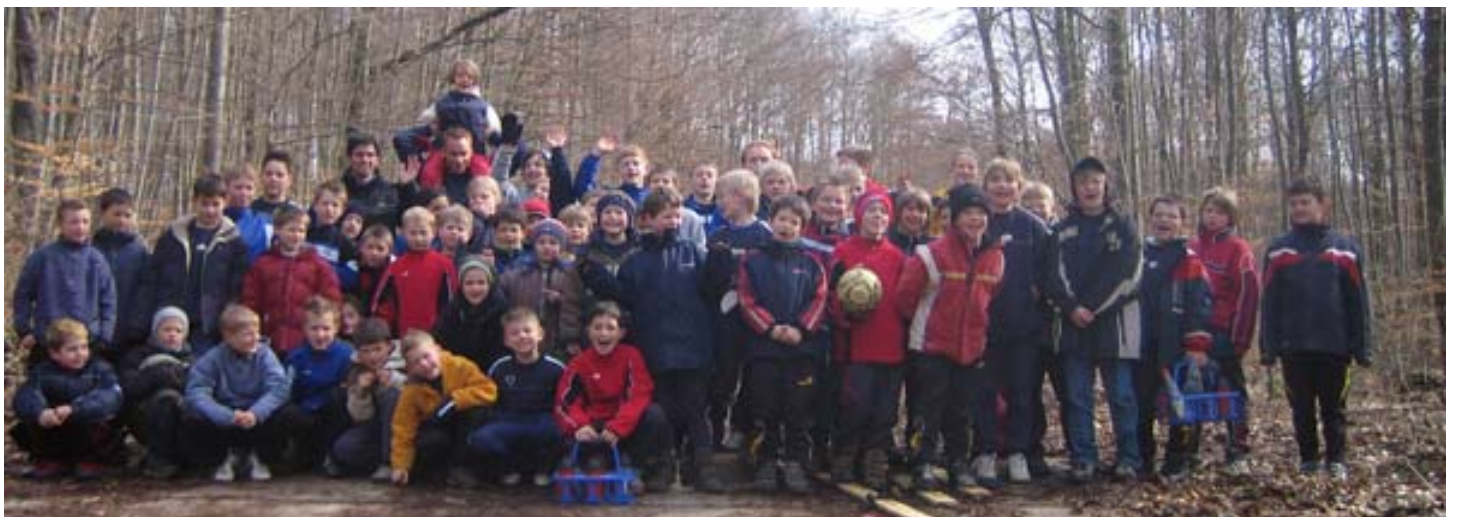
Ich zähle 54 Köpfe – Gruppenfoto nach den Waldspielen